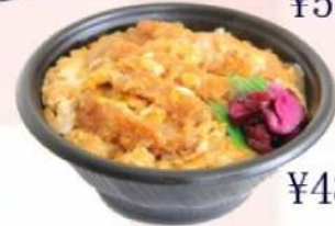
井ぶりの定番 カツ丼 ¥482(税込¥520)