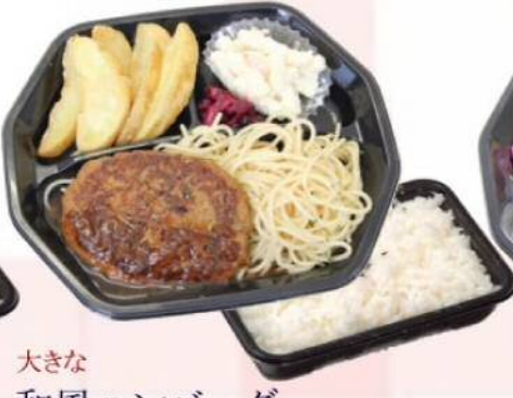
大きな 和風ハンバーグ ¥519(税込¥560)