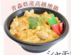
青森県産高級地鶏 シャモロック ¥519(税込¥560)