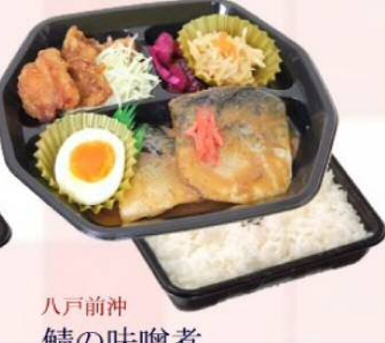
八戸前沖 鯖の味噌煮 ¥547(税込¥590)