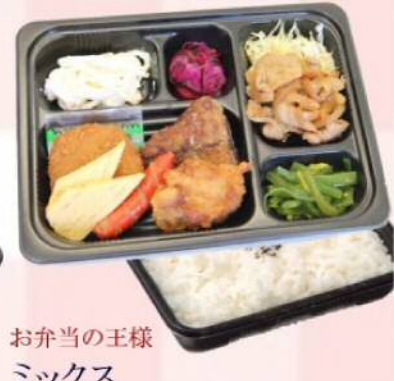
お弁当の王様 ミックス ¥528(税込¥570)