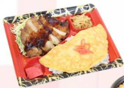
人気のお弁当が1つになった とり玉 ¥482(税込¥520)