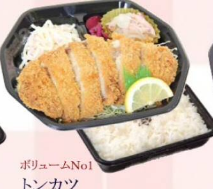
ボリュームNo1 トンカツ ¥510(税込¥550)