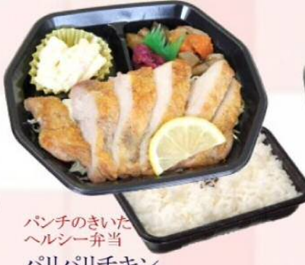
パンチのきいたヘルシー弁当 パリパリチキン ¥510(税込¥550)