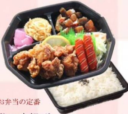
お弁当の定番 鶏の唐揚げ ¥510(税込¥550)