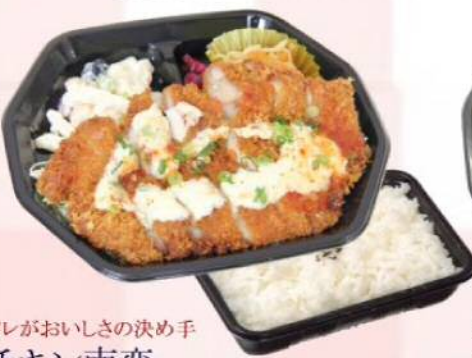
タレがおいしさの決め手 チキン南蛮 ¥510(税込¥550)