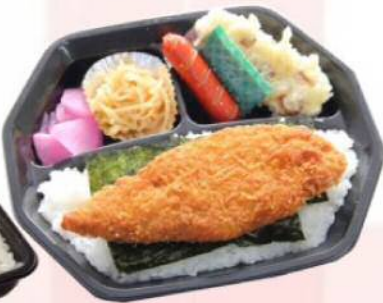
うれしいお手頃価格 白身魚フライ ¥362(税込¥390)