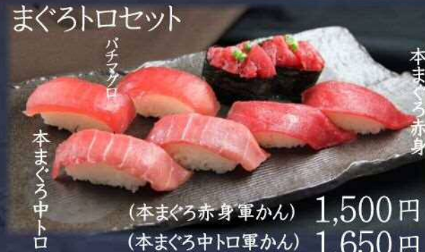
まぐろトロセット